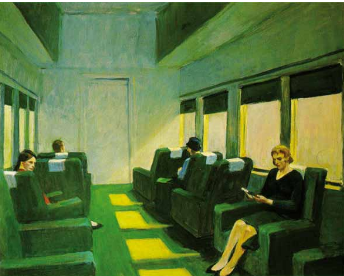
Edward Hopper Chair car , 1965